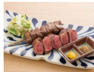
『地頭鶏の炭火焼き(ハーフ)』 B1F 牛タン たんか