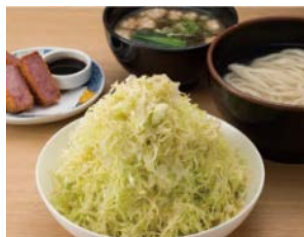
『長介サラダ』 B1F ニ〇加屋長介