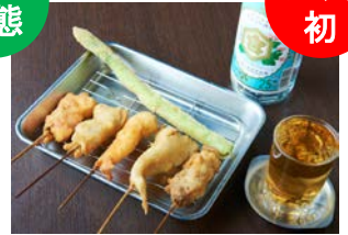
串揚げの四文屋 [串揚げ]