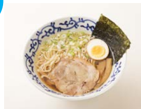
支那そば 月や [ラーメン]