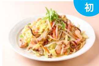
ぴかまつ一番 [博多皿うどん・ちゃんぽん]