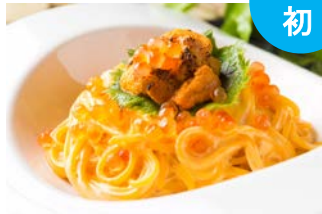
スイートバジル [パスタ]