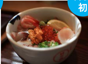
海鮮丼 日の出 [海鮮丼・海鮮定食]