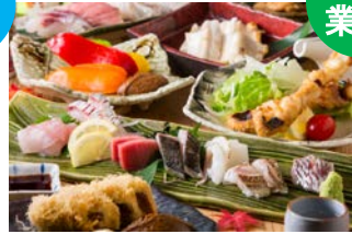
長浜鮮魚卸直営 炉端 魚助 [炉端居酒屋]