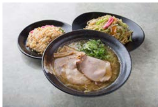
博多川端 どさんこ [ラーメン・焼飯・博多皿うどん]