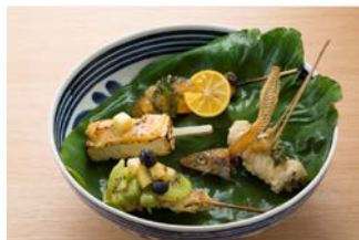
10F 天串 魚串ひさご (天串 魚串) 「獺祭フェア限定ぜいたく串」