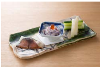
10F 京都ぎをん 八咫 (京料理) 「獺祭の酒粕チーズとお酒のおつまみ」