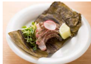
9F ごはん家 椒房庵 (ごはん・汁・地酒) 「昆布め伊佐木の炙り」