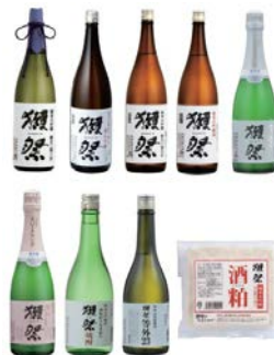
↑計9種類の獺祭をご提供